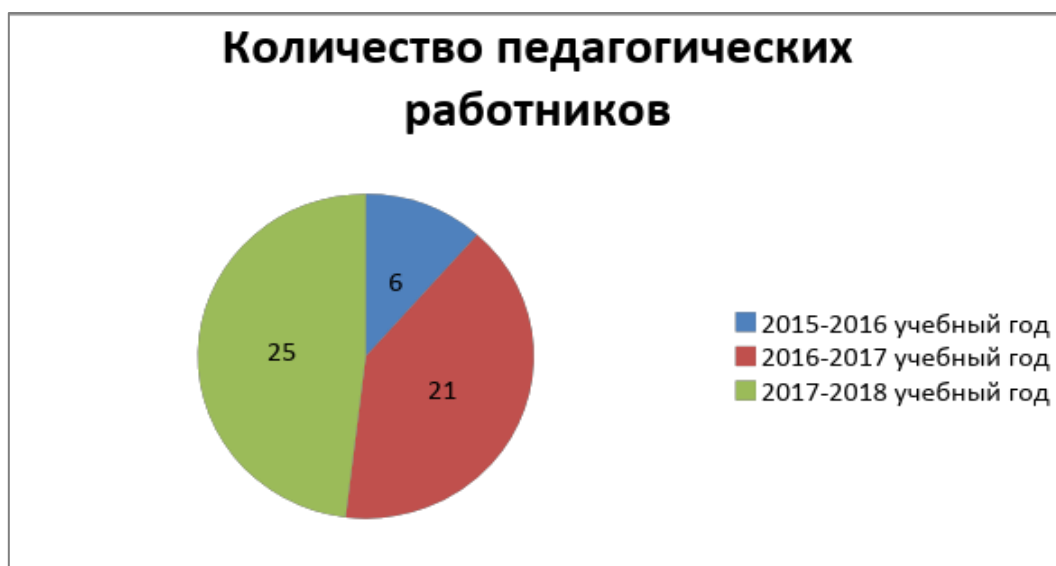
Диаграмма 2. Профессиональная переподготовка и повышение квалификации педагогических кадров

Для совершенствования педагогического мастерства и развития кадрового потенциала Дома творчества созданы необходимые условия. Кадровый состав можно считать достаточно стабильным. Основа коллектива – это опытные педагоги (57%), эффективно реализующие цели и задачи учебно-воспитательного процесса. Данные педагоги стимулируют развитие всего коллектива, поддерживают авторитет Дома детского творчества «Союз». 38% педагогов имеют стаж педагогической работы не более 5 лет. Тем не менее, они серьезно относятся к своей образовательной деятельности, постоянно работают над повышением своего профессионализма, заинтересованы в применении инновационных технологий в образовательном процессе, принимают активное участие во всех мероприятиях.