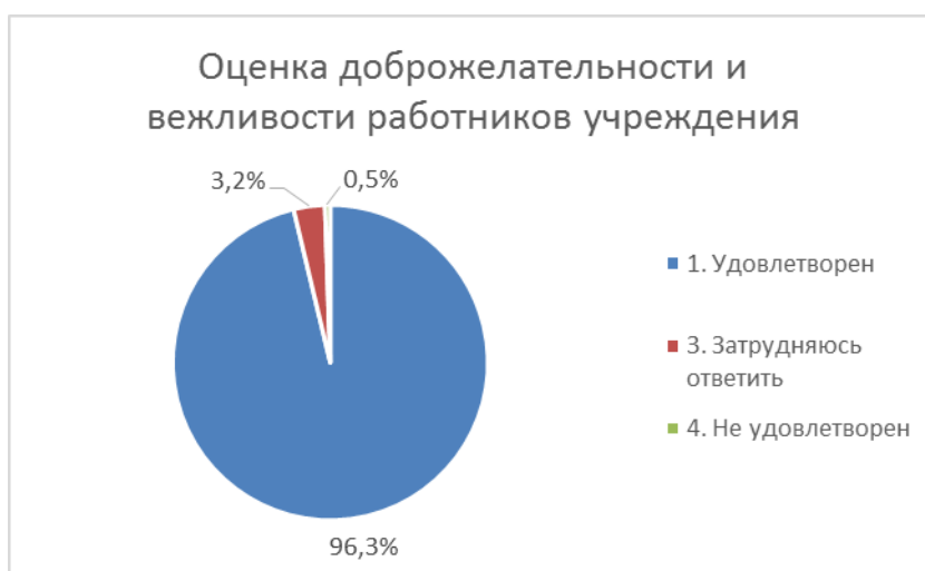
Диаграмма 3. Оценка доброжелательности и вежливости работников учреждения

Из диаграммы видно, что преобладающее большинство опрошенных (96,3%) высоко оценивают доброжелательность и вежливость работников