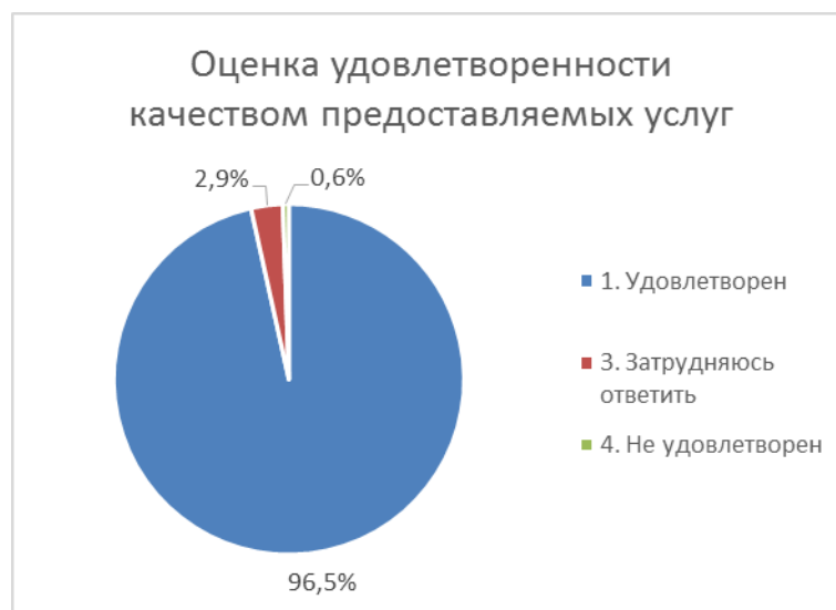
Диаграмма 6. Оценка удовлетворенности качеством предоставляемых образовательных услуг

Высокую оценку качеству предоставляемых образовательных услуг дали 96,5% родителей, участвовавших в анкетировании, что свидетельствует о высокой степени удовлетворенности. Низко оценили этот показатель 2,9%, затруднились ответить 0,6% респондентов.