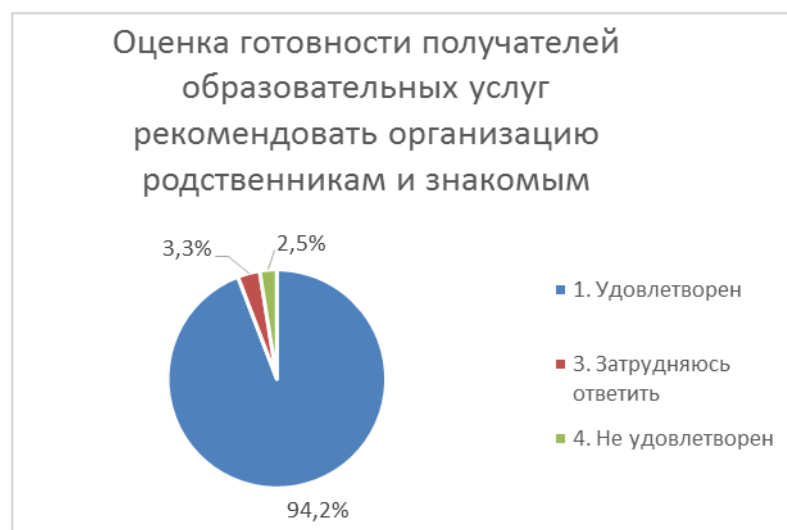
Диаграмма 7. Оценка готовности получателей образовательных услуг рекомендовать организацию родственникам и знакомым

Большинство участвовавших в анкетировании родителей проявили готовность рекомендовать организацию родственникам и знакомым – 94,2%, лишь 2,5% опрошенных ответили отрицательно, 3,3% затруднились дать ответ на этот вопрос.