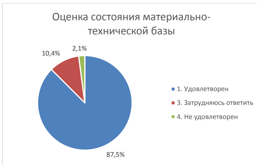
Диаграмма 3. Оценка состояния материально-технической базы

Этот показатель оценивается родителями несколько ниже. Так, только 87,5% удовлетворены состоянием материально-технической базы учреждения, 10,4% отметили показатель как низкий, 2,1% респондентов затруднились ответить.