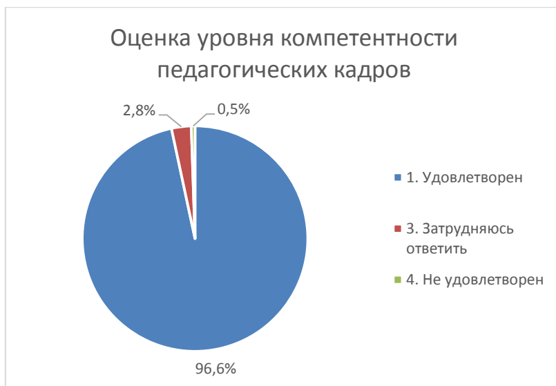
Диаграмма 2. Оценка уровня компетентности педагогических кадров

Преобладающее большинство родителей отметили высокий уровень компетентности педагогических кадров (96,6%), затруднились ответить 2,8 % респондентов и только 0,5 % опрошенных отметили этот показатель как низкий.