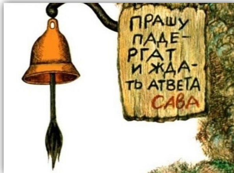
Рисунок 1. Мануал для входа

Если рисунок/диаграмма заимствована из официальных источников (журнал, монография, автореферат диссертации, официальный сайт организации и т.п.), необходимо сделать ссылку.