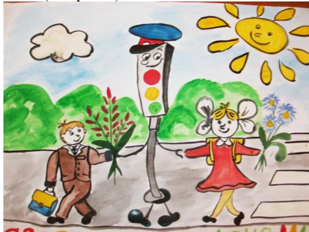
Рисунок 1. Иллюстрация к занятию